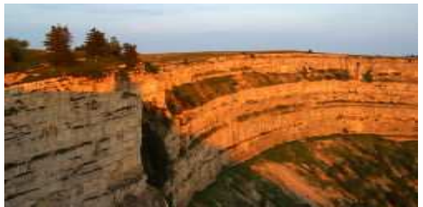
Creux du Van au petit matin

Voilà le clou du voyage ! Après une mise en jambe agréable en longeant l'Areuse vous vous retrouverez prêt à rejoindre le majestueux Creux-du-Van. De Travers (725m) au Soliat (1463m), la montée est rude mais l'effort est récompensé par la vue sur ce cirque impressionnant. Ensuite, la descente en direction de Boudry, semée de passages techniques, fera appel à votre expérience. Arrivé dans la cité médiévale, vous longerez le bord du lac jusqu'au chef lieu cantonal.