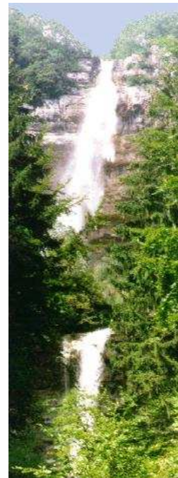
Le saut du Doubs

Quittons les bords du Doubs et, en prenant quelque altitude, rejoignons la Vallée de La Brévine. Verts pâturages, bordés de cordons de sapins, nous sommes dans les hauteurs neuchâtelaises... Le passage par la Chaux du Millieu nous rappelle que ces contrées ont été colonisées vers les années 1300. Certaines fermes soulignent cette histoire. Puis l'arrivée dans la Sibérie helvétique : La Brévine, petit village très sympathique, où nous vous recommandons fortement la visite du Temple récemment rénové et datant du XVI ème siècle.