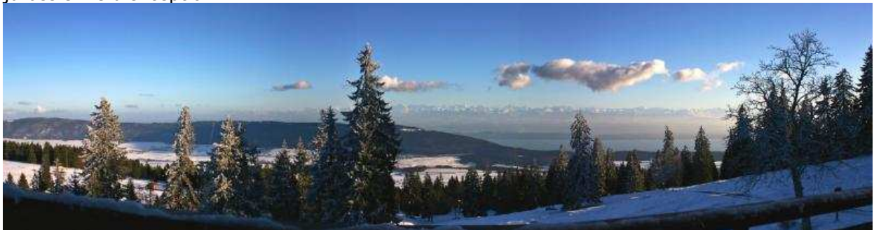
La vue depuis Tête de Ran en hiver

Au départ de St.-Imier, un transfert en bus jusqu'aux Bugnenets est prévu et de là, par le chemin des crêtes on rejoint la Vue des Alpes, d'où vous aurez une vue splendide sur les Alpes et le lac de Neuchâtel. Un regard en arrière montre le massif du Chasseral dans toute sa beauté. Une randonnée toute en hauteur permettant d'admirer la vue et cette nature jurassienne d'exception.